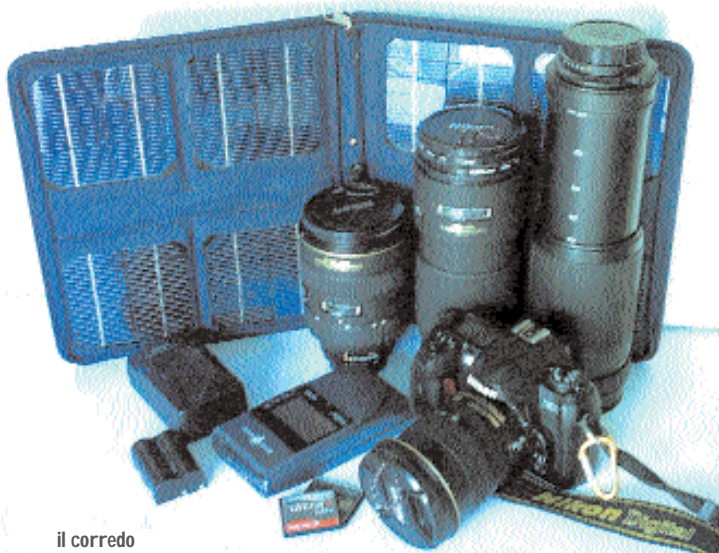
il corredo per il K2