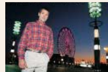
Ritratti notturni (Sincro a tempi lenti)