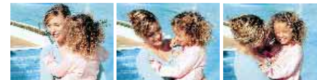
* Solo per E5200 (E4200: circa 1,3 fotogrammi/secondo)

Grazie all'avvio pressoché istantaneo, le COOLPIX 5200/4200 sono pronte allo scatto non appena incomincia l'azione. E con la ripresa in sequenza alla cadenza di circa 2,5 fotogrammi al secondo*, anche il soggetto più dinamico può essere catturato in tutta la sua espressività.