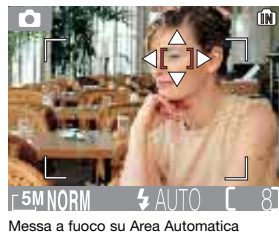
Messa a fuoco su Area Automatica