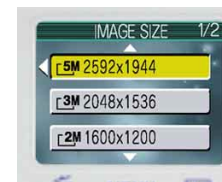
L'interfaccia "amichevole" rende più fluido l'impiego