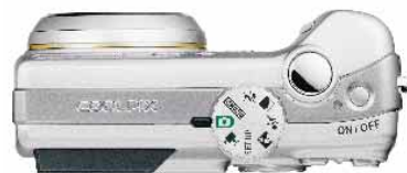
Il selettore dei modi, pratico e agevolmente raggiungibile

Linee morbide, e comandi a portata di mano: entrambi gli apparecchi assegnano molta importanza al confort del fotografo. Un confort a cui contribuisce largamente l'interfaccia utente di tipo grafico (GUI), facile da vedere come da utilizzare.