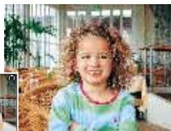
L'Assistenza Ritratto offre alle riprese di persone una composizione più gradevole ed efficace.