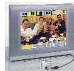
* Solo per E5200 (E4200: circa 15 fotogrammi/secondo)

La COOLPIX 5200 è in grado di registrare videoclip a 30 fotogrammi/secondo*, scorrevoli ed omogenei come quelli professionali, e completi di commento audio. Grazie alla facilità di collegamento, ora è molto comodo rivedere sul televisore di casa i familiari e gli amici in azione.